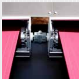
Båda modellerna kan motoriseras och seriekopplas.